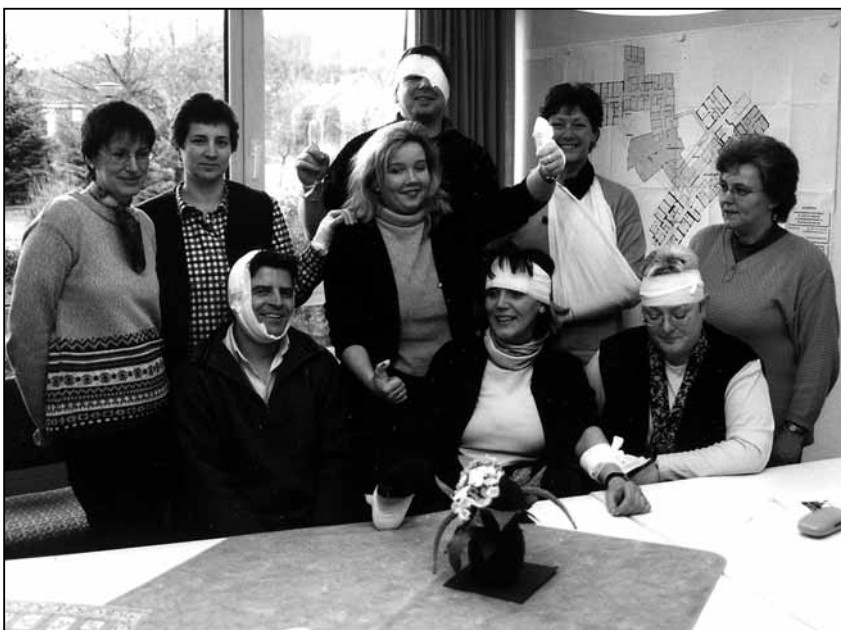
Hier wird die „Verbundenheit“ mit dem Stift deutlich.