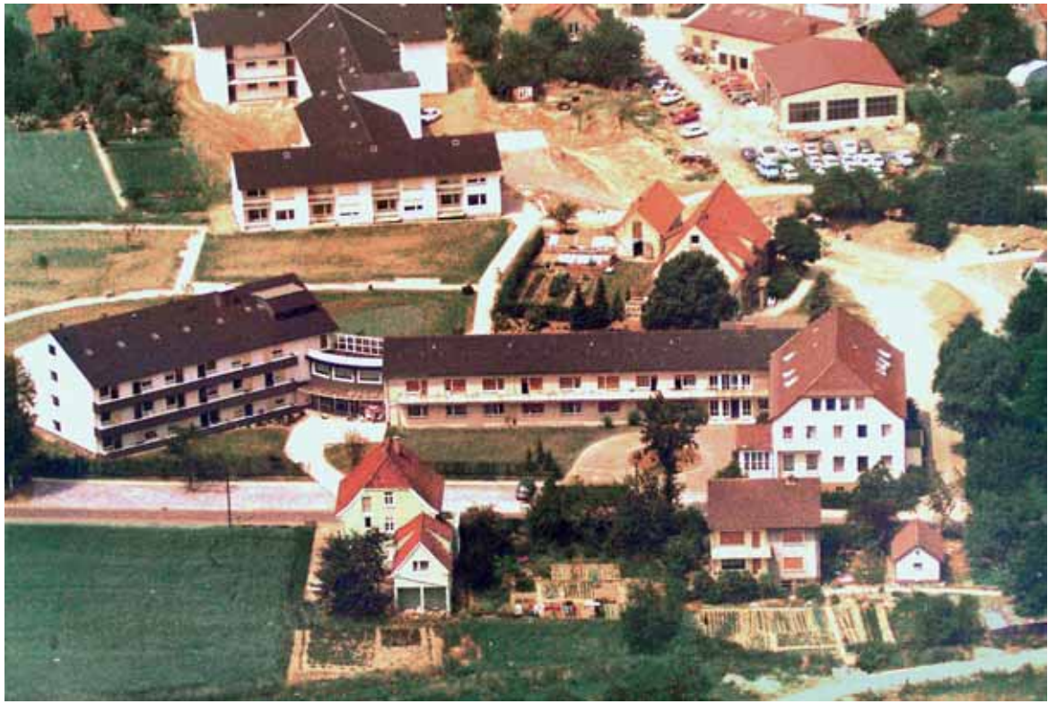
Luftaufnahme vom Stift zu Wüsten etwa aus dem Jahre 1972