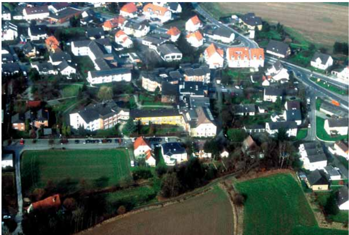
Das Wüstener Stift aus der Vogelperspektive, aufgenommen an einem Februarsonntag im Jahre 2002.